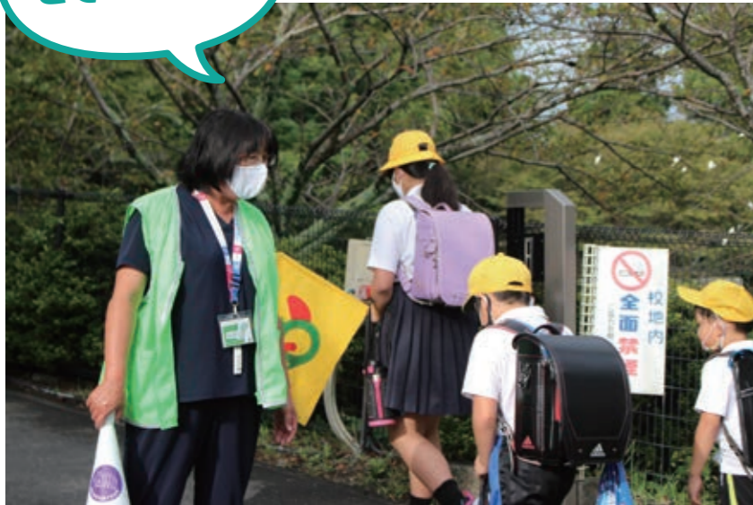
通学路では地域の各種団体ボランティアの方々が毎日子どもたちの安全のために道路に立って下さっています!