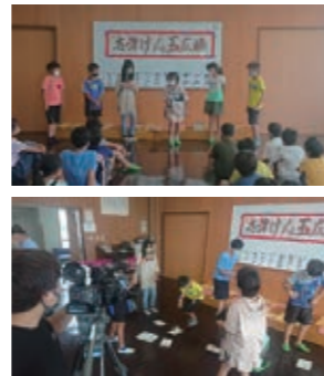
志津けん玉広場の活動がZTVで放送されました!

新型コロナウイルス感染症拡大防止のため、しばらく休会であった志津まちづくり協議会文化部が主催する「志津けん玉広場」が活動再開されました。それぞれ進級した子どもたちも楽しみに待っていたようで、練習を積み重ねて自慢の技を披露したり、低学年の友達に丁寧にやさしく教えてあげる姿を見ることができました。また、7月18日の開催日にはZTVが取材に来られ、子どもたちの元気な活動をレポートしていただき7月20日に放送されました。志津は、小学校や地域全体でけん玉を通して、教科学習では培えない集中力や自己肯定感を高めることで基礎的な力を育てています。志津けん玉広場は月一回まちづくりセンターで開催されています。気軽に覗いてみてはいかがでしょうか?お父さんもお母さんも、普段とは違った子どもたちの一面を見ることが出来ますよ!